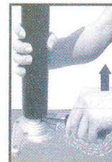
3.- para desmontar, solo levante con desarmador