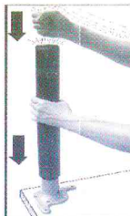
2. coloque la pata sobre la base y presione